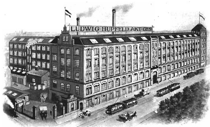
Abb. 2: Die Fabrik der Ludwig Hupfeld A.-G., Apelstraße 4, in: Ludwig Hupfeld A.-G., Electro-Pianos und Orchestri-ons, Leipzig 1911, Nachdruck, hrsg. v. GSM, 2009, f. 101v

Vom Hauptbälge aus werden 72 kleine pneumatische Bälge entsprechend den Öffnungen im perforierten Notenblatte in Bewegung gebracht und die kleinen Bälge setzen wieder 72 korrespondierende sogenannte ‚Finger‘ in Bewegung, den 72 Öffnungen im Skalenblocke entsprechend. 7