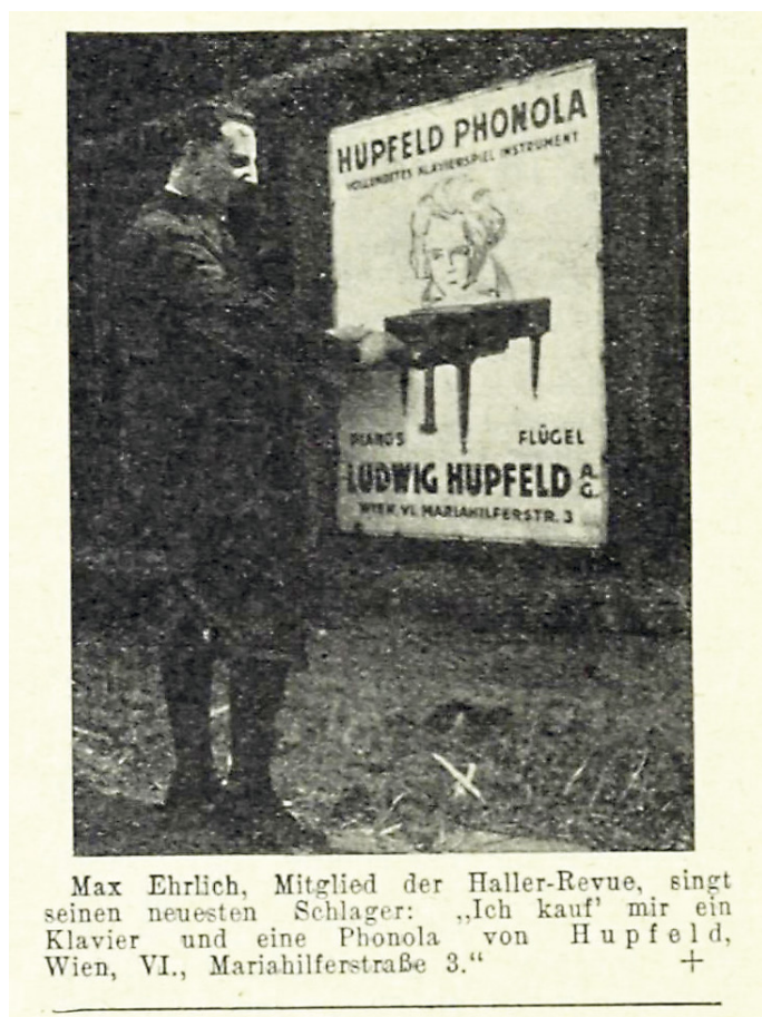
Abb. 1: Anzeige für einen Hupfeld-Schlager

Die HUPFELD'sche Phonola tritt in Romanen und Filmen des frühen 20. Jahrhunderts als omnipräsentes Instrument auf und wird wie ein Möbelstück oder irgendein beliebiges Instrument darin in der Regel eher beiläufig erwähnt. 1 Thematisch erscheint sie dagegen in Broschüren, Anzeigen und anderen Werbeschriften des Herstellers, der LUDWIG HUPFELD A.-G. Unter diesen Werbeschriften befindet sich sogar ein kompletter Roman, in dem ein Phonolaspieler für einen großen Klavierkünstler gehalten wird. 2