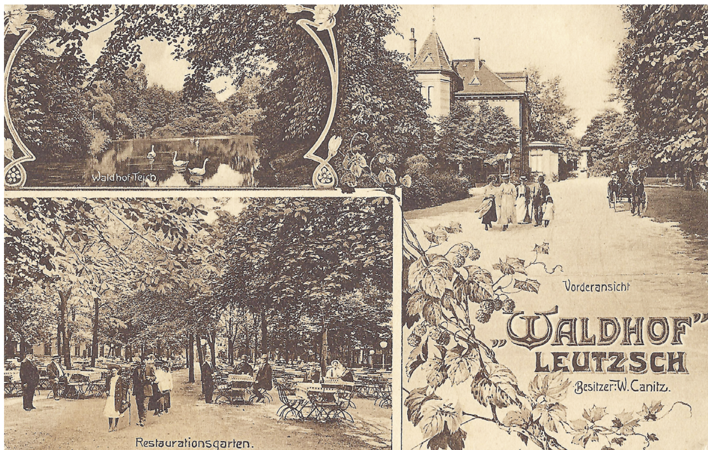
Abb. 5: Die Gaststätte Waldhof in Leipzig-Leutzsch (Postkarte, um 1911, Privatbesitz)

relevante, übersprungene Inhalte in eckigen Klammern zusammengefasst.